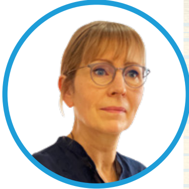
Valerie Julliard Kepala Perwakilan PBB di Indonesia